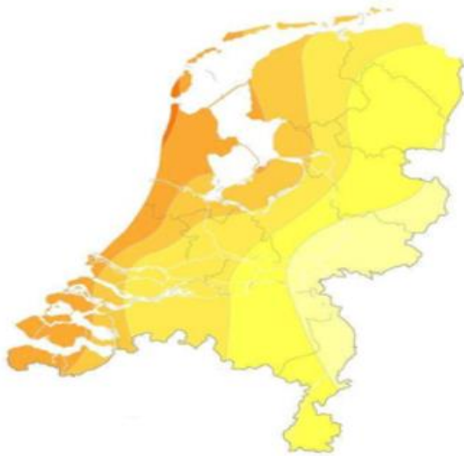
Gemiddeld aantal zon uren